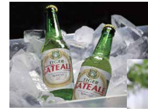
Erstellt hoch individuelle Etiketten mit Sonderfarbe Weiß