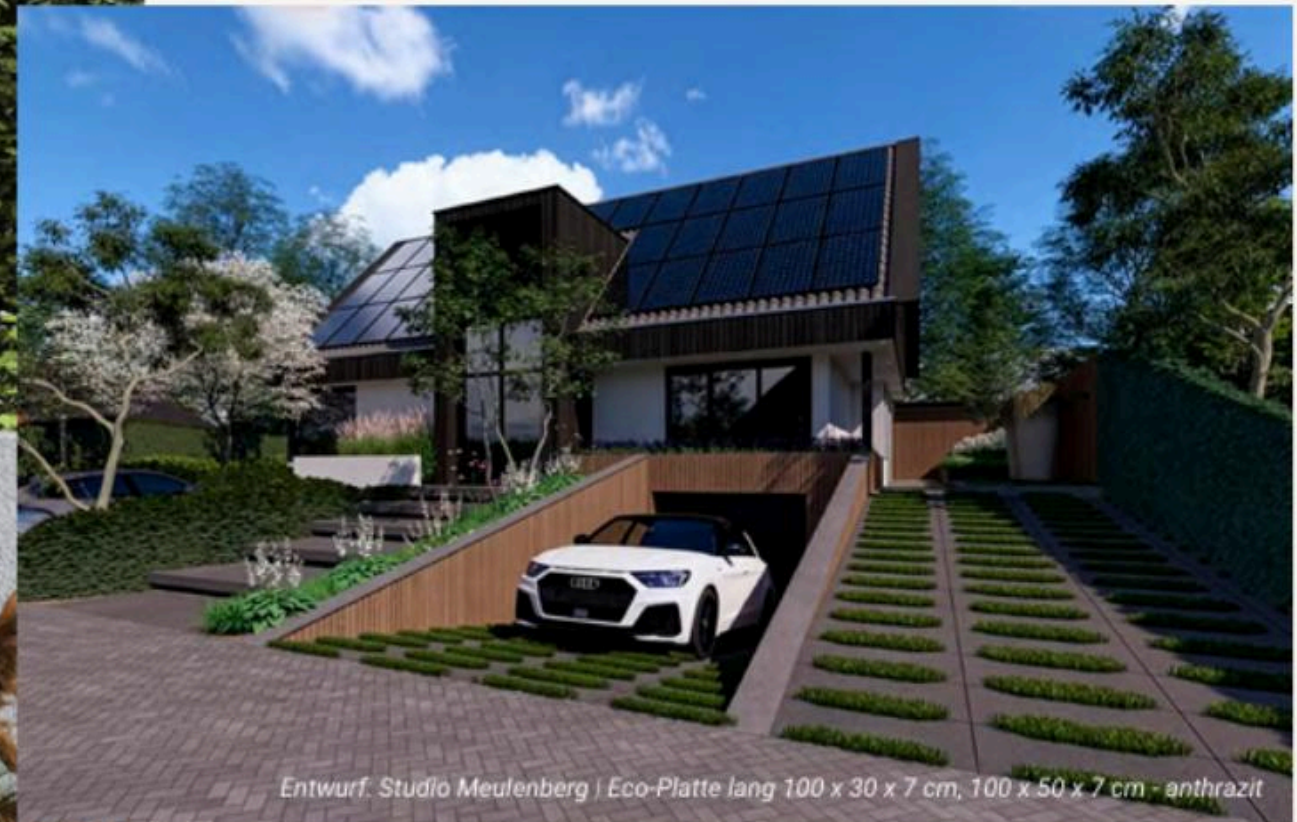
Entwurf: Studio Meulenberg | Eco-Platte lang 100 x 30 x 7 cm, 100 x 50 x 7 cm - anthrazit