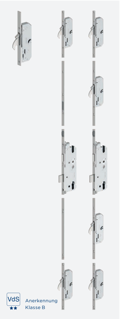
autoLock AV4D Automatik-Verriegelung Variante ... M2 bzw. M4