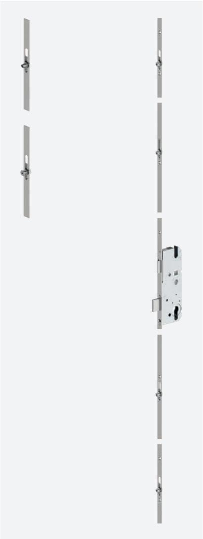
easyLock R/RT/T/A/AC/C Rastex- zenter und/oder Pilzkopfverriegelung Variante ... R4/RT4/T4/A4/AC4/C4