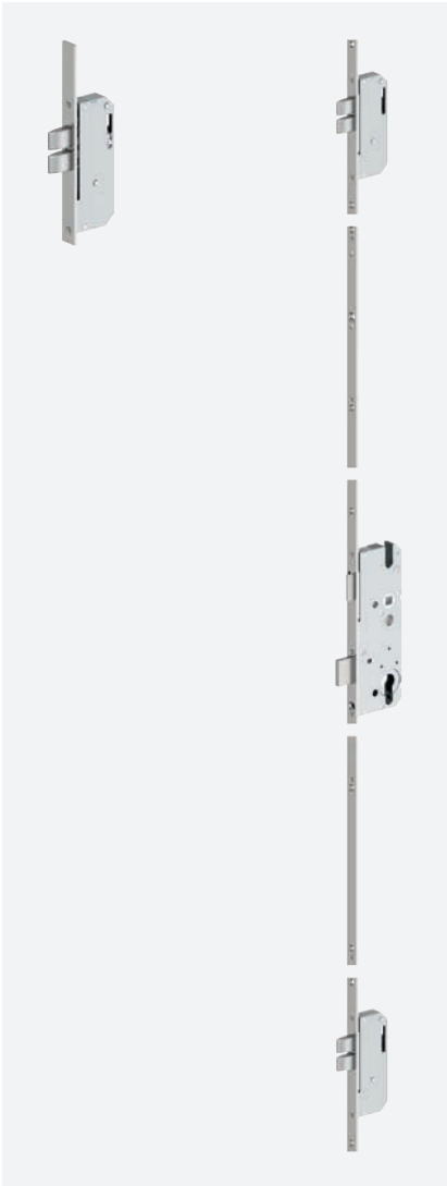
solidLock D Doppelriegel-Verriegelung Variante ... D2