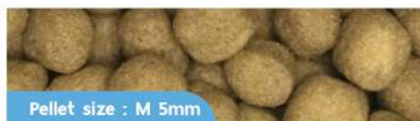
Pellet size : M 5mm