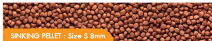
SINKING PELLETS : Size S 8mm