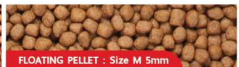
FLOATING PELLETS : Size M 5mm