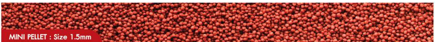
MINI PELLETT : Size 1.5mm