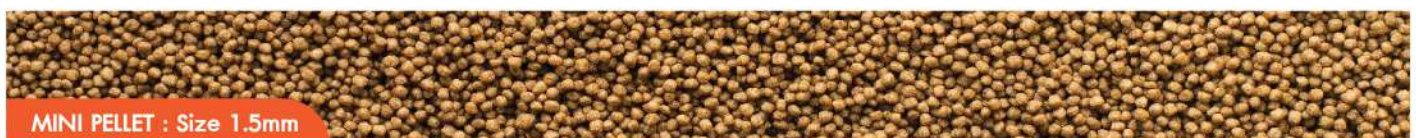
MINI PELLETT : Size 1.5mm