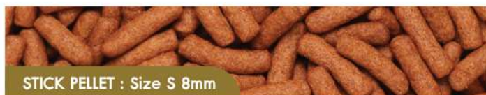
STICK PELLETS : Size S 8mm