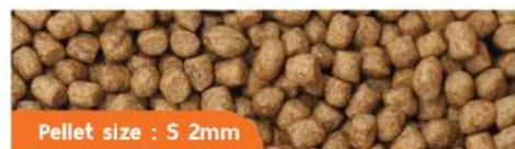
Pellet size : S 2mm