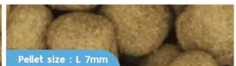
Pellet size : L 7mm