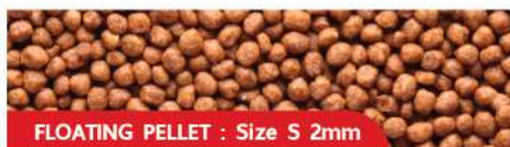
FLOATING PELLETS : Size S 2mm