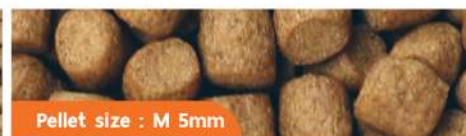
Pellet size : M 5mm