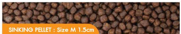
SINKING PELLETS : Size M 1.5cm