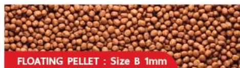
FLOATING PELLETS : Size B 1mm