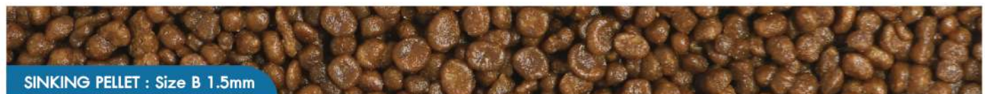
SINKING PELLET : Size B 1.5mm