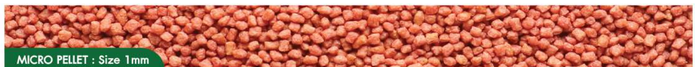
MICRO PELLET : Size 1mm