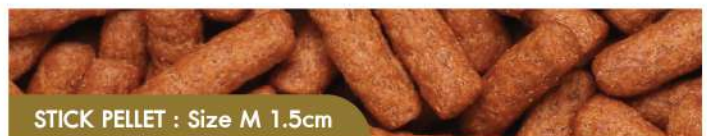
STICK PELLETS : Size M 1.5cm