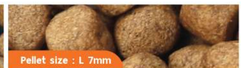
Pellet size : L 7mm

PACKAGING : 550g / 1.25kg / 4kg / 6.5kg / 15kg