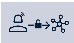
Breakout- & Secure-Landing-Calls