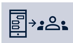
Einzel- und Gruppenchats