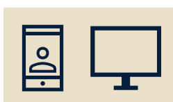
Videoanrufe, Dateiversand in Chats und alle Anwendungen im Desktop-Client