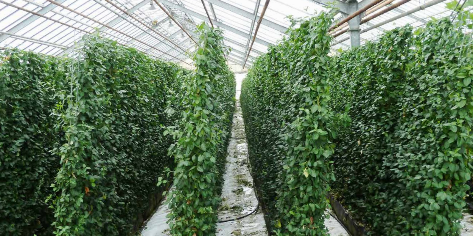
Helix-Produktion 'Hecke am laufenden Meter' ® mit Euonymus fort. 'Coloratus'