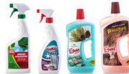
Detergents and Home Care