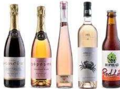
Wine and Spirits