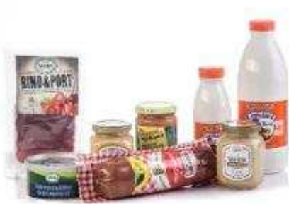
Food and Beverages