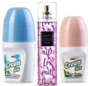
Cosmetics and Personal Care