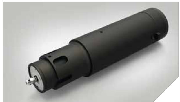
KCT – Kiss-Cut-Tool schneidet in die Oberfläche, nicht in das Trägermaterial (Messerandruck)