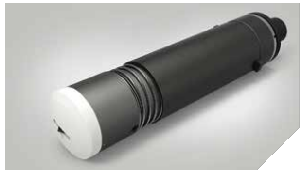
UCT – Universalmesser tangential kontrolliert