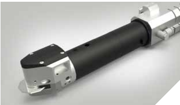
PRT – Angetriebenes Rundmesser bis zu 11.000 Umdrehungen / min