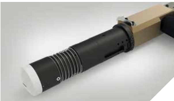
EOT – Oszillierendes Messer bis zu 15.000 Schwingungen / min