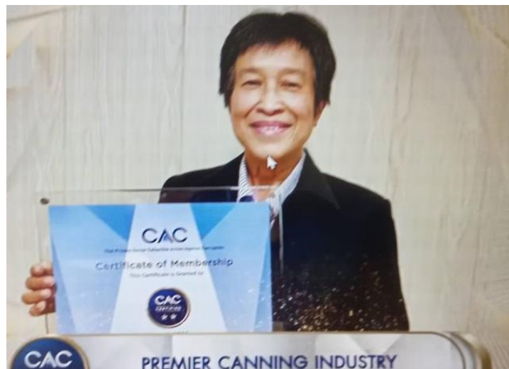
CAC Certification Ceremony on July 12, 2022

Thai Institute of Directors (IOD) as secretary of the Committee of the Anti-Coalition Corruption of the Private Sectors of Thailand (CAC) has notified the results of its consideration to certify Premier Canning Industry Co., Ltd. as a member of the Thai Private Sector Collective Action Coalition against Corruption. The aforementioned certification will be valid for 3 years (June 2021 - June 2024).