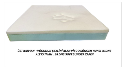
ÜST KATMAN : VÜCÜDÜN SEKLİNİ ALAN VİSCO SÜNGER YAPISI 35 DNS ALT KATMAN : 28 DNS SOFT SÜNGER YAPISI