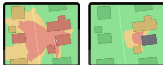
ohne Schallschutz mit Schallschutz Beispiel für Schallbelastung

Wenige Angaben, maximale Genauigkeit: Sie nennen uns lediglich Standort und Gerätetyp – wir liefern mithilfe unserer innovativen Schallsoftware und hochwertigen 3D-Modellen Ihrer Geräte eine exakte Schallberechnung auf Grundlage realer Standortbedingungen. Profitieren Sie von einer sicheren Planung, ohne überflüssige Sicherheitszuschläge und mit größerer Gestaltungsfreiheit für Ihr Projekt. (Artikel-Nr. 87009993)