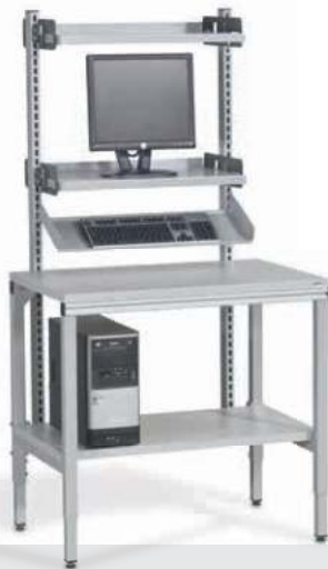
WARENANNAHME & WARENKONTROLLE

Unsere Mitarbeiter beraten Sie in den unterschiedlichsten Etappen des Produktionsprozesses und erarbeiten auf Ihr Geschäft zugeschnittene Vorschläge.