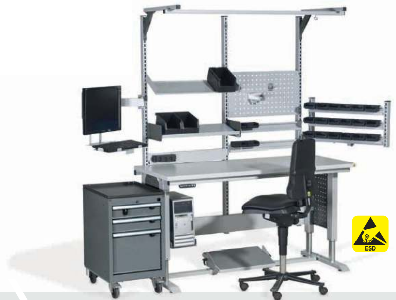
FERTIGUNG & MONTAGE