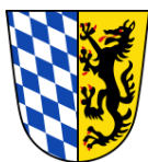
Stadt Bad Reichenhall, Lkr. Berchtesgadener Land