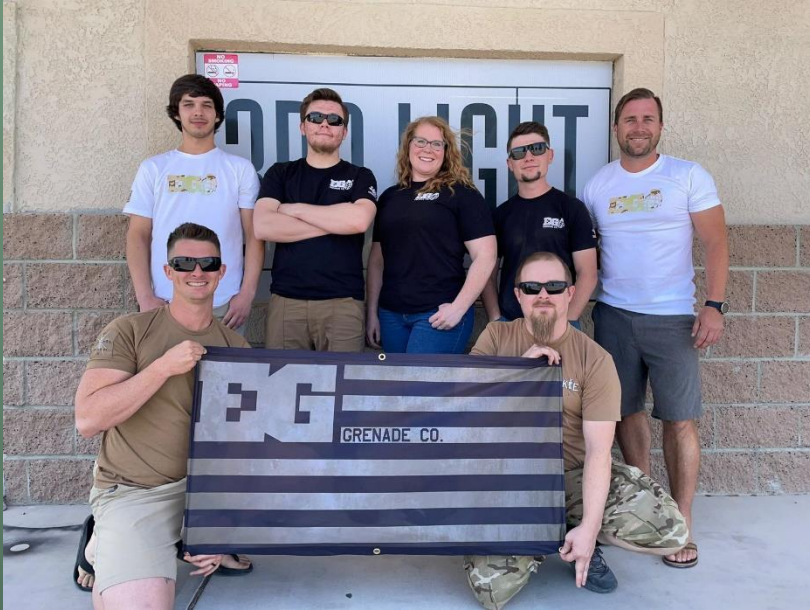
Team United States America