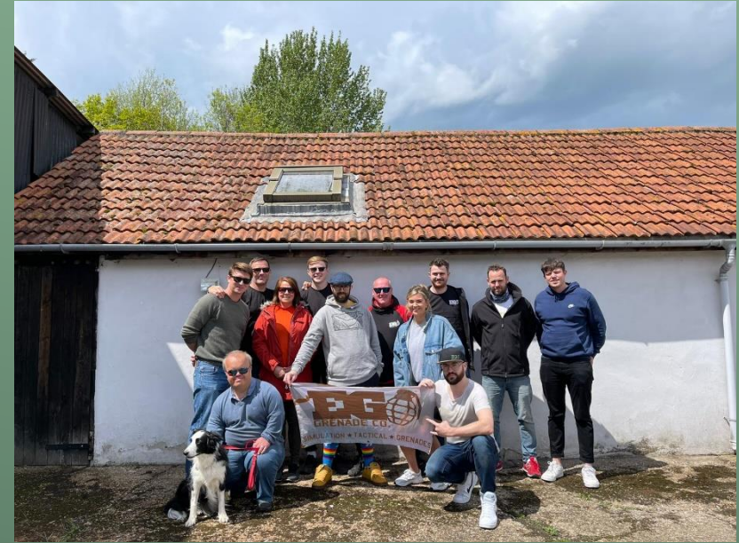
Team United Kingdom