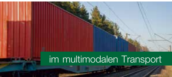
im multimodalen Transport