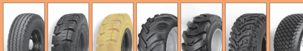
INDUSTRIAL FORKLIFT FORKLIFT ANTITRACCIA TRACTOR SKID ALL TRAC GARDEN