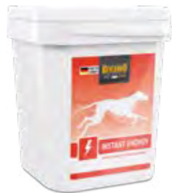
Instant Energy Dose 500 g und Eimer 3 kg